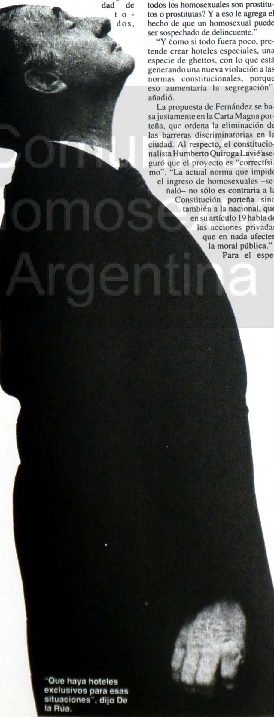
"Que haya hoteles exclusivos para esas situaciones", dijo De la Rúa.