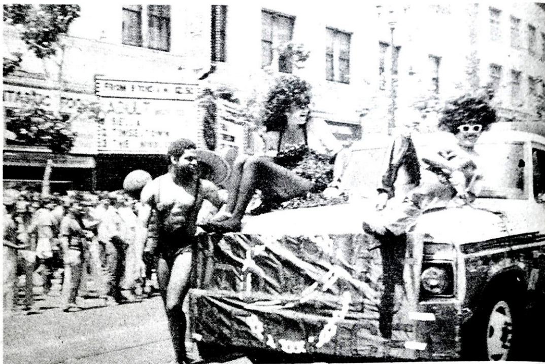
En EE.UU los gays prácticamente están integrados a la sociedad. Eso pretende la comunidad que los aglutina en Argentina.

que acabar con los homosexuales, sugiriendo confinarnos en campos de concentra