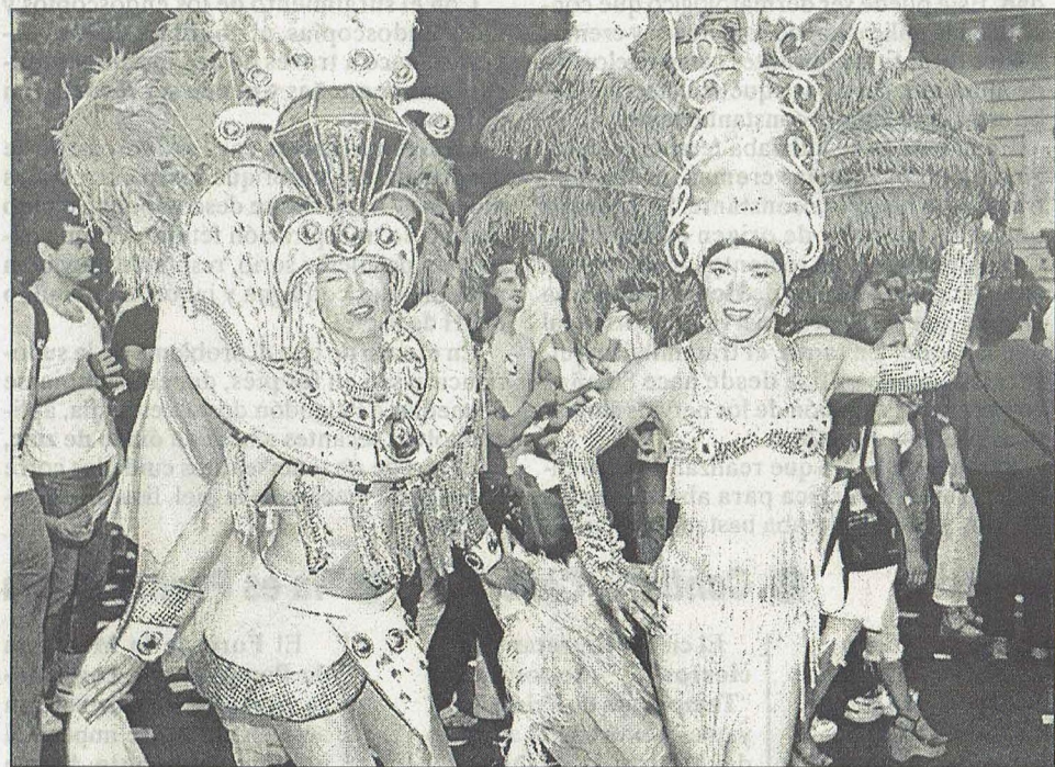
Carrozas y mucho color durante el desfile organizado para el Orgullo Gay.